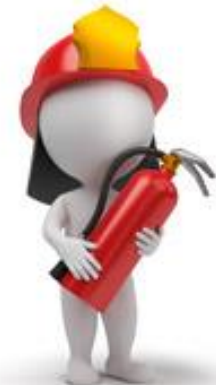
Red contra incendios