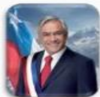
Los Presidentes: Aylwin, Frei, Lagos, Bachelet, gobernaron en Chile en un régimen presidencial.